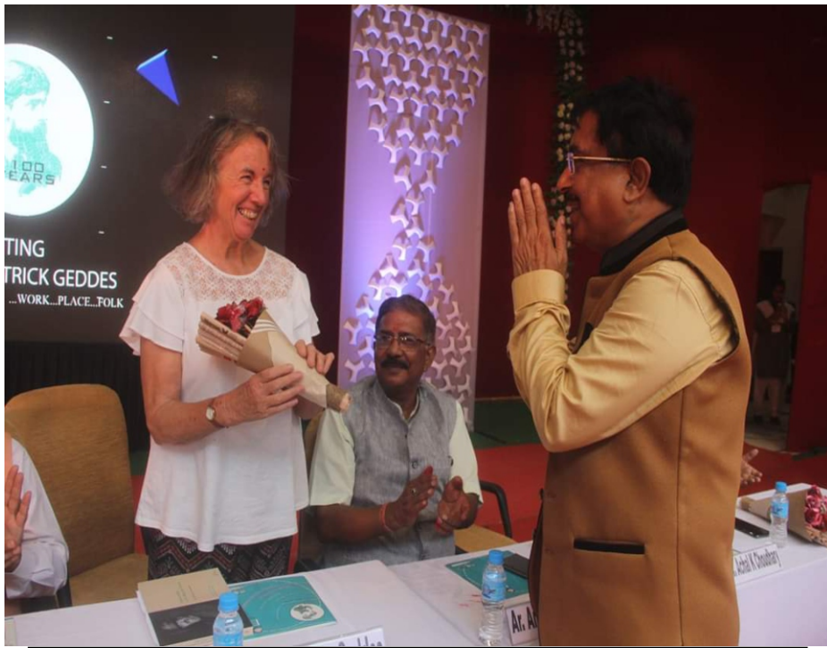
Inauguration of IPS Academy, School of Architecture International Conference with the theme Revisiting Patrick Geddes - Welcoming Guests