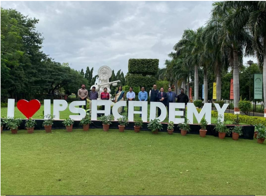
Celebrating 25 years of Excellence in Education