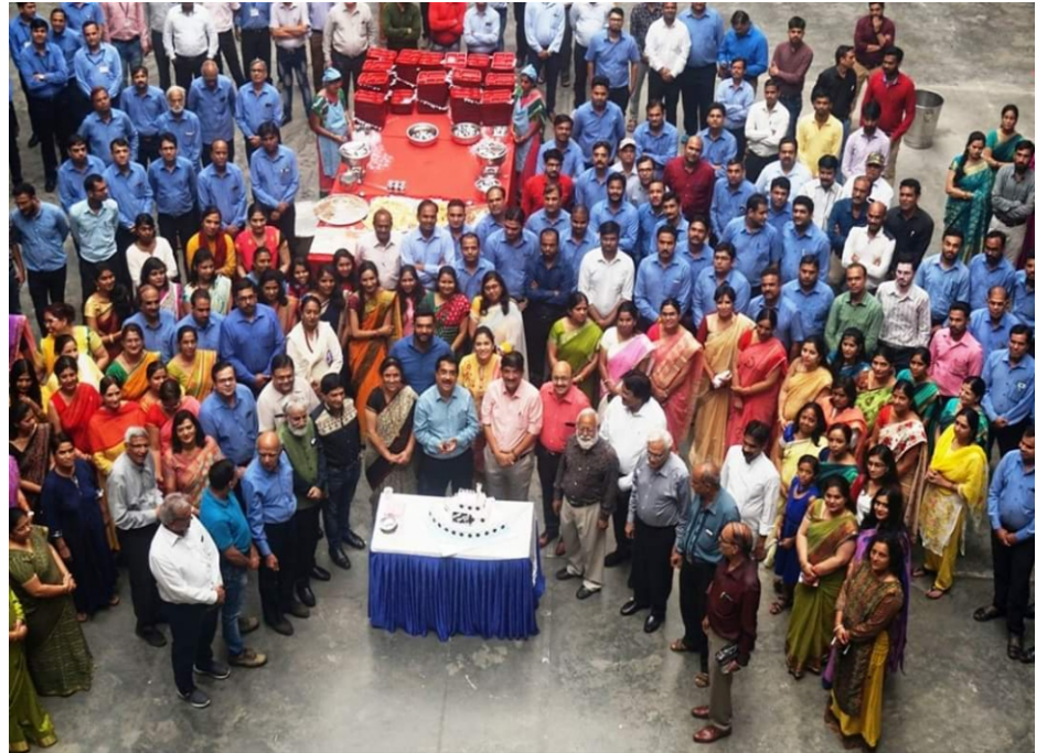
Teachers Day was celebrated in IPS Academy