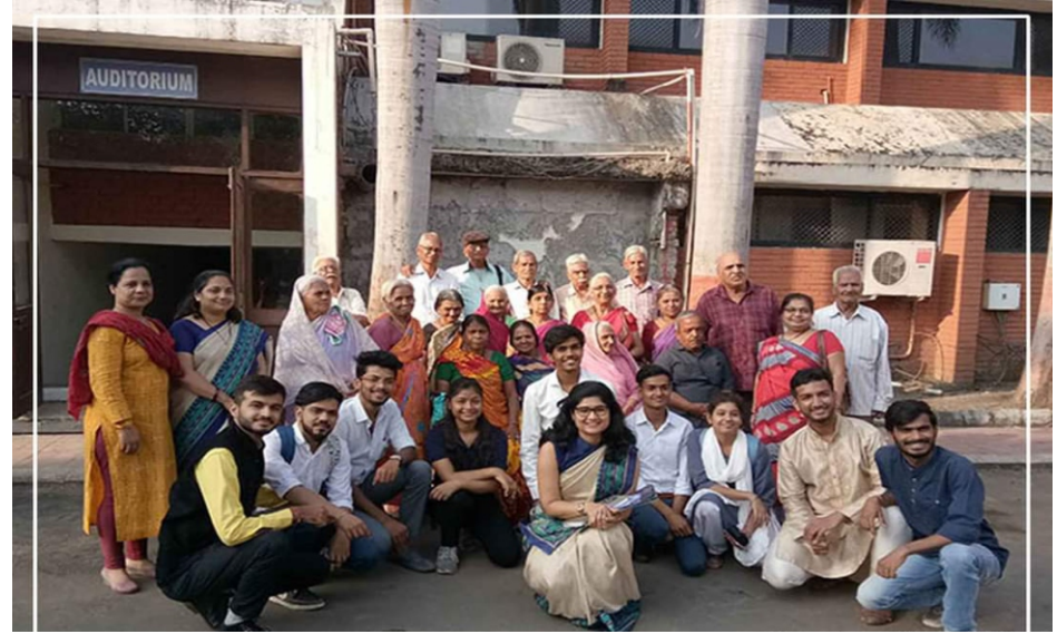
On 15 October 2019, an Open mic session was held by ICSR/NSS, IPS Academy, where students welcomed people from old age homes and engaged them. The subject of Open Mic was global warming, water preservation and how the legacy given by the old can support nature. The old present in the program felt happiness and overlooking their distresses and sang melodies and moved in bliss, after several performances of poetry and magic