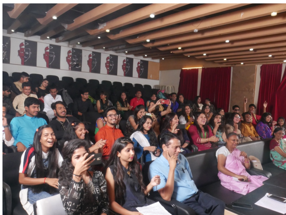
Ethnic Day was Celebrated By Mass Communication in Navaratri.