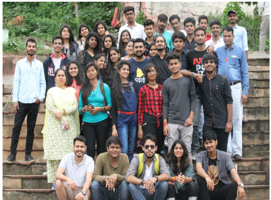
A wonderful trip to Maheshwar was organized by Mass Communication Department.